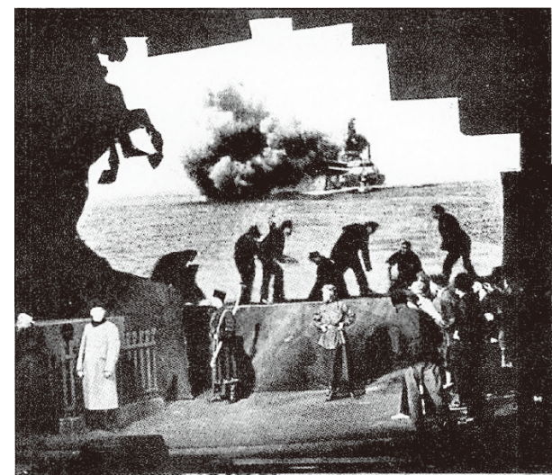
ピスカートルの舞台で実際の戦争の映像資料が背景に使われている様子

この特徴は依頼者ピスカートルが自身の演劇論を表現するために「全体劇場」案の計画以前から開拓してきた 演出手法 である。