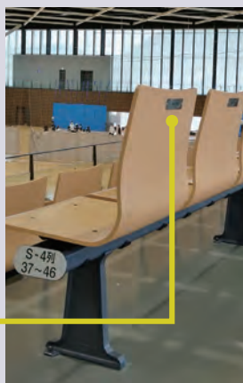
芳名プレート設置イメージ