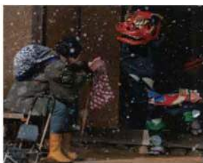
外務大臣賞「獅子とお話」

6月1日の「写真の日」を記念して、写真の楽しさや記録の大切さを広める写真展の福岡巡回展です。