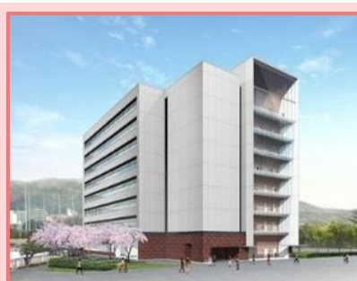
人間科学部新棟(3号館)