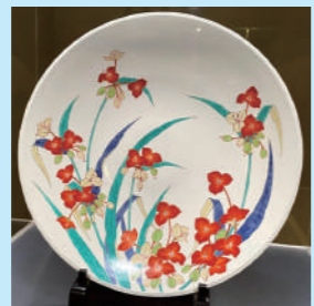
十四代 酒井田 柿右衛門 にし で むらさき つく き もん はち 濁手紫露草文鉢