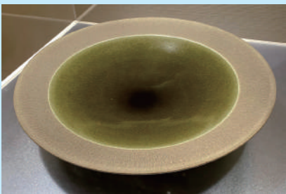
福島 善三 てつ ふう かけ わけ はち 鉄釉掛分鉢