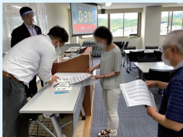
7月に実施した時の様子