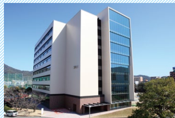
文系新棟(3号館)建設 人間科学部設置に伴い、 新棟を建設