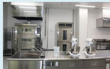
食品加工プラント(11号館) 生命科学部で食品を 製造・加工する実習室を設置