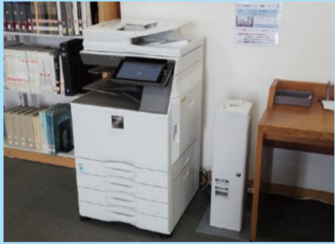
4階 第6閲覧室のコピー機

1階、2階、4階にコイン式のコピー機を設置しています。 ルールを守ってご利用ください。