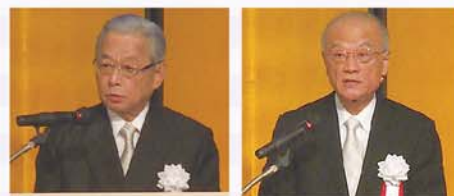
理事長・学長の挨拶

11月3日(火)、九州産業大学「開学55周年記念式典」を開催し、来賓、大学関係者、卒業生など約250人が出席しました。