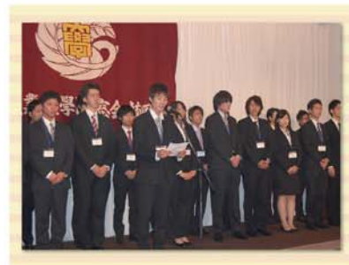
学生県人会紹介の様子