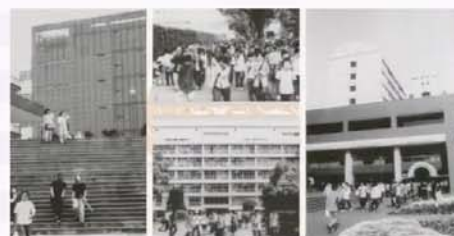
開学55周年記念式典オープニングMOVIE