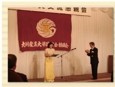
功労賞表彰の様子