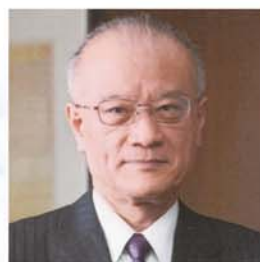
九州産業大学 学長