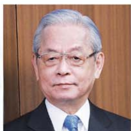
学校法人中村産業学園 理事長