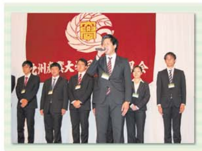
学生県人会紹介の様子