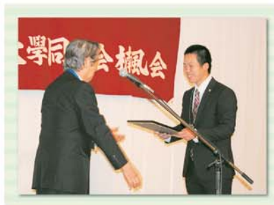
功労賞表彰の様子