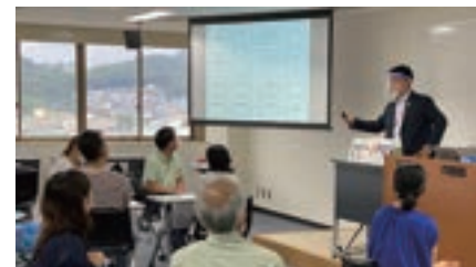
※2020年度 リカレント講座の写真