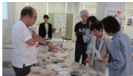
※2019年度 シニア・カレッジ講座の写真