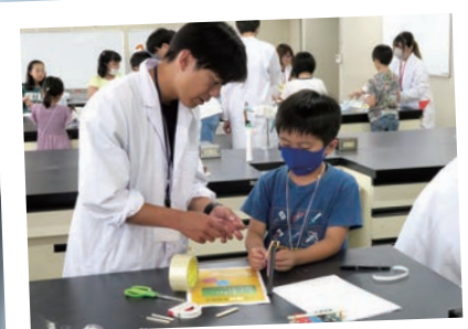
子ども理科実験教室