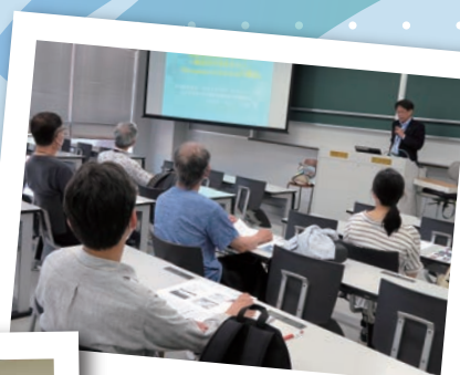
経済安全保障を考える (座学)