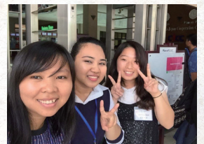
▲カンボジアで現地の学生と

高校の時から、カンボジアの貧困で苦しむ子どもたちのために、募金活動や物資を送るボランティアをしており、将来は、国際協力団体などで働きたいです。