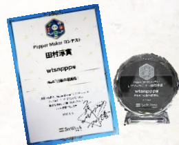
▲記念に贈られた賞状と記念品