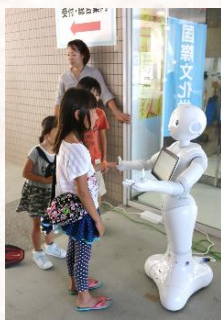
▲オープンキャンパスの様子

A Pepper は、オープンキャンパスなどで、登場していますが、毎日使ってもらえる活躍の場を考えました。また、図書館の利用客アップにもつながると考えたからです。